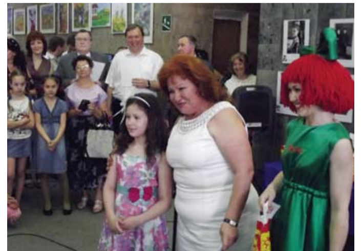
Фото с депутатом на память