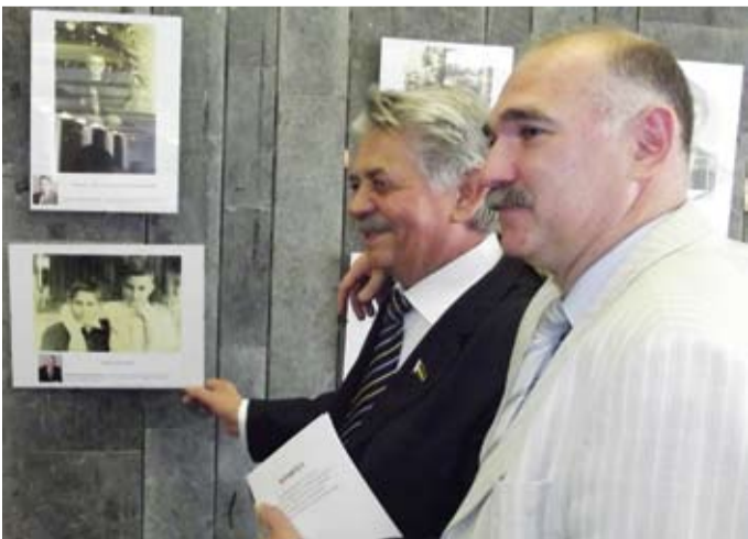
Возле детских снимков