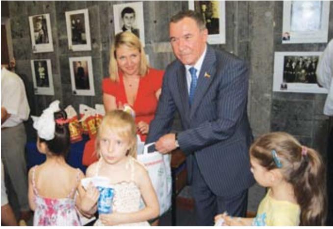
Всем – мороженого!